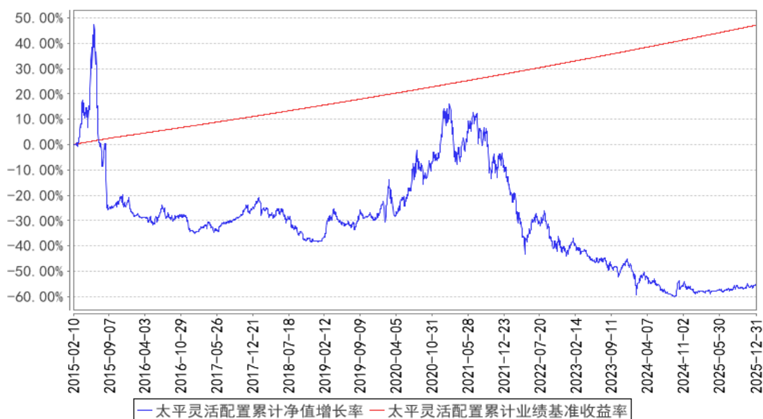
太平灵活配置累计净值增长率与同期业绩比较基准收益率的历史走势对比图

注：本基金基金合同生效日为 2015 年 02 月 10 日，本基金的建仓期为 6 个月，建仓期结束时各项资产配置比例符合本基金基金合同规定。图示日期为 2015 年 2 月 10 日至 2025 年 12 月 31 日。